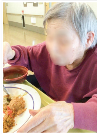
普段少食の方もたくさん食べられました