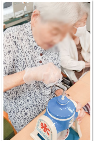
ご利用者様に削っていただきました!