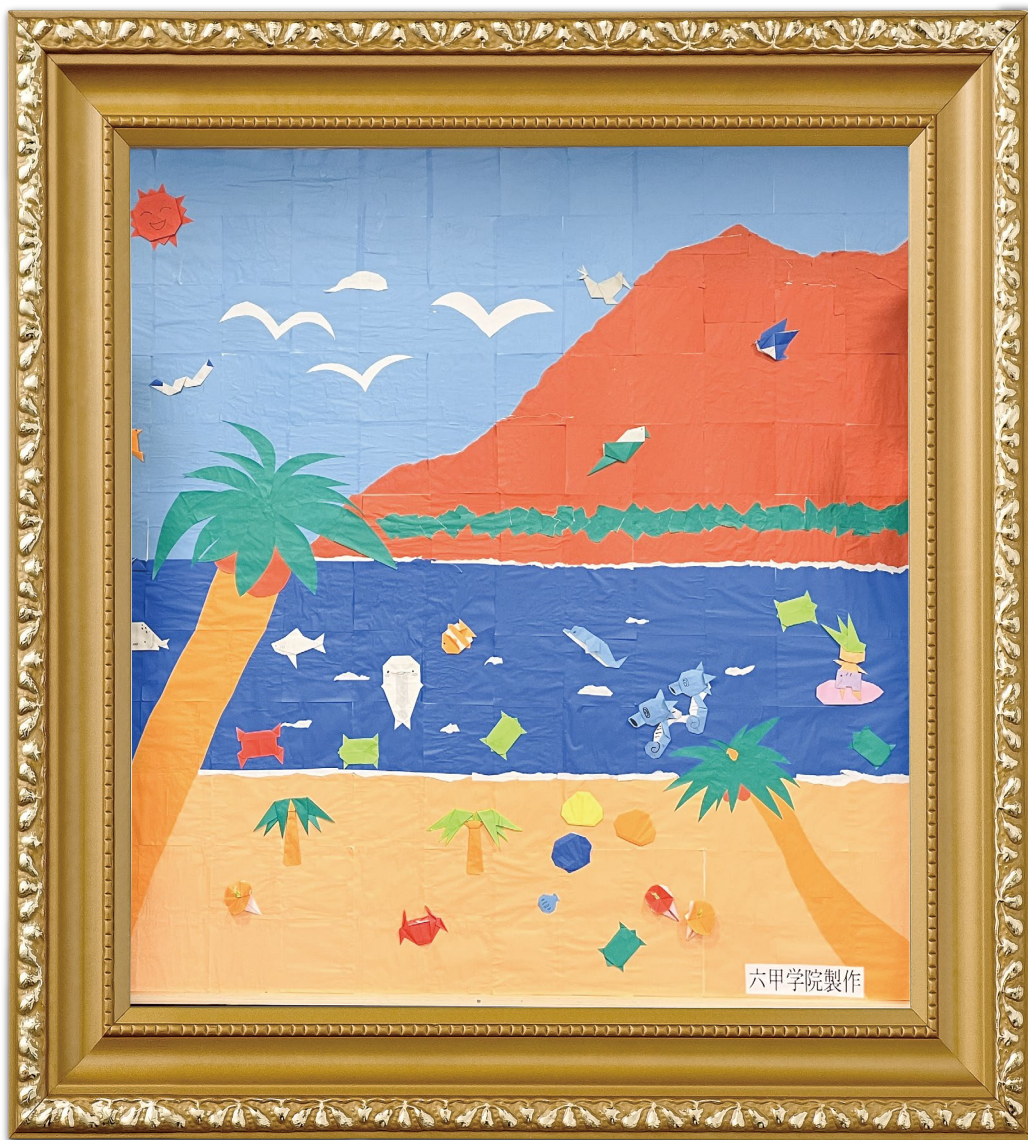
タイトル：コスモぴあ ハワイアンサマーフェスティバル 作：六甲学院高等学校