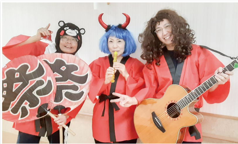
チームワーク🌸です!