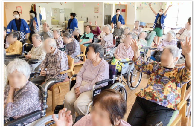
音頭に合わせて踊り