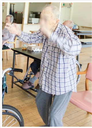
立ち上がって踊り出した利用者さん