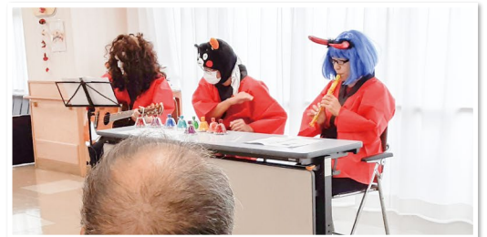
ご利用者様の応援もあり、がんばれました。