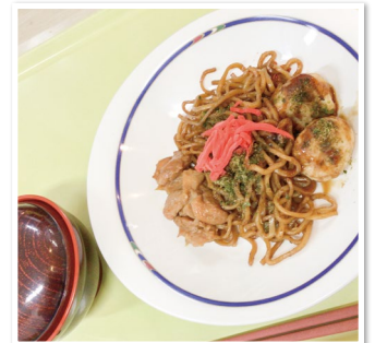
屋台の定番焼きそば・たこ焼き・やきとり