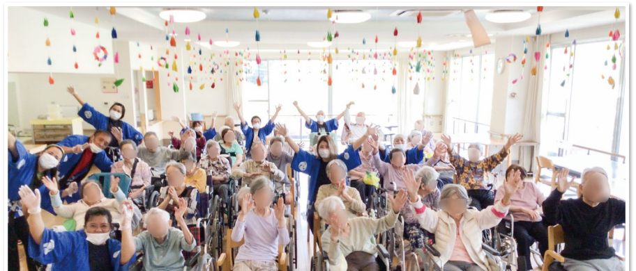
最後はみんなで集合写真