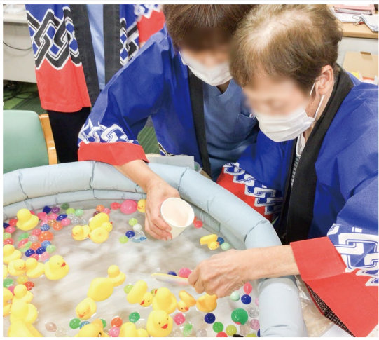
縁日気分を味わっていただきました。