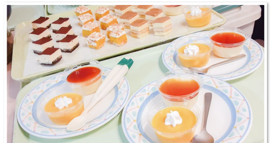
好評だったケーキバイキングです。