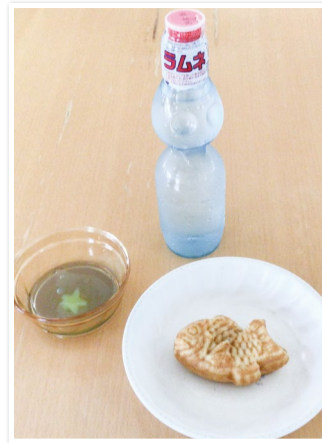
懐かしのラムネ・たいやき・サイダーゼリー