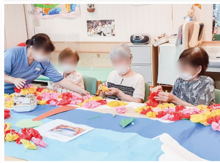
毎月恒例の壁画制作の様子。